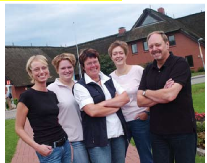
Das Nordseebad Dornum setzt „IncomingSoft“ in der Meldescheinverwaltung ein. Das Foto zeigt die Mitarbeiter der Kurverwaltung.

Viele namhafte Kurorte und Seebäder setzen inzwischen das System „IncomingSoft“ der Firma Intobis mit großem Erfolg ein.